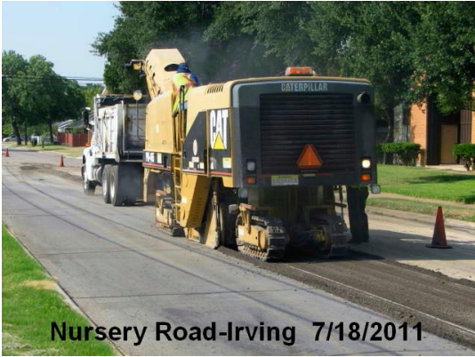
Nursery Road-Irving 7/18/2011