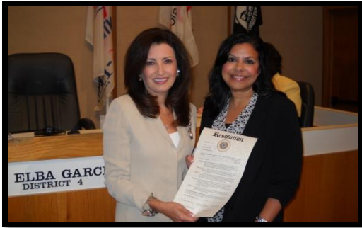
Irving Girl Scouts

Gracias a todas las organizaciones y personas por su tiempo y esfuerzo!