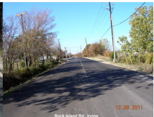
Rock Island Rd., Irving