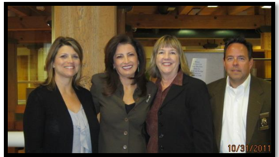
Red Ribbon Week