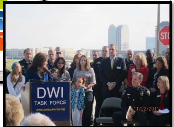
La Comisionada Garcia en una Conferencia de Prensa presentando el DWI Taskforce