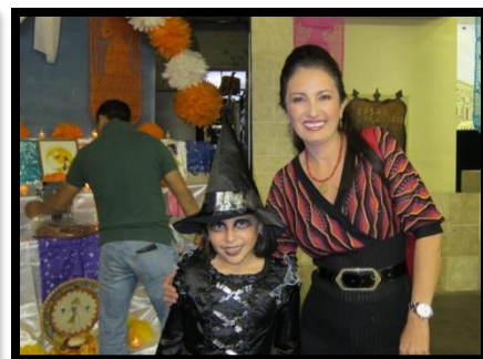
Casa Guanajuato Halloween Party