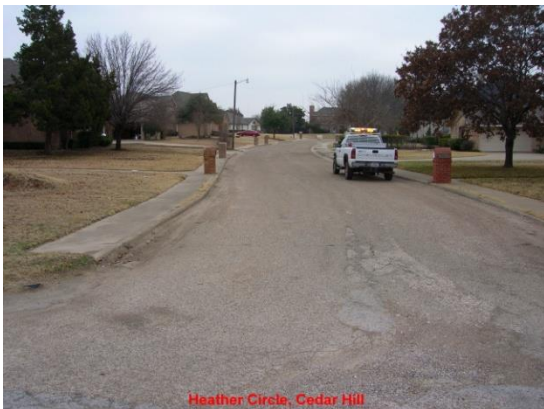
Heather Circle, Cedar Hill