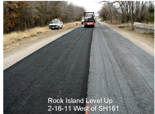
Rock Island Level Up 2-16-11 West of SH161