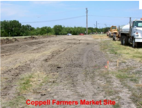
Coppell Farmers Market Site