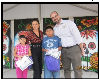
North Oak Cliff Library