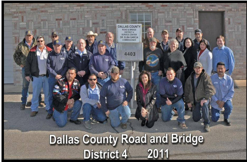
Dallas County Road and Bridge District 4 2011