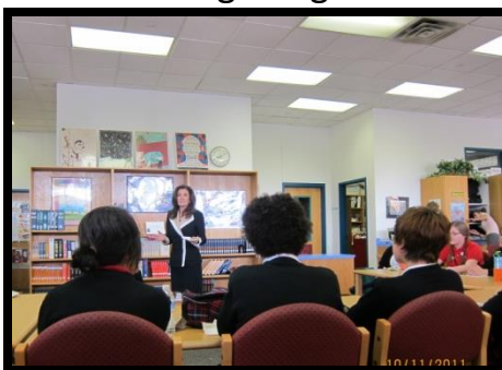
Irma Rangel High School