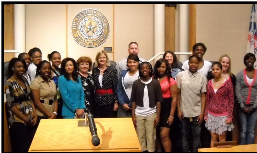
MacArthur High School's Lady Cardinals