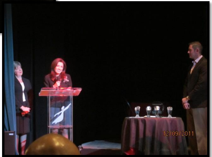
La Comisionada Garcia agradeciendo a su familia, empleados y a la Camara de Comercio de Oak Cliff despues de recibir su reconocimiento