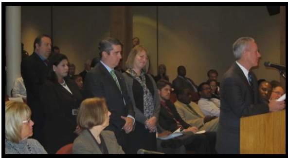
Dallas Children's Advocacy Center