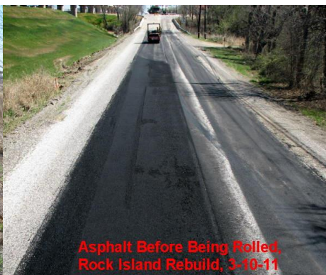
Asphalt Before Being Rolled, Rock Island Rebuild, 3-10-11