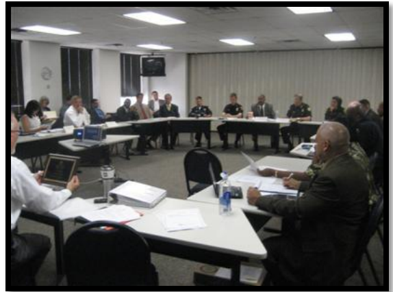
July 2011 CJAB Meeting