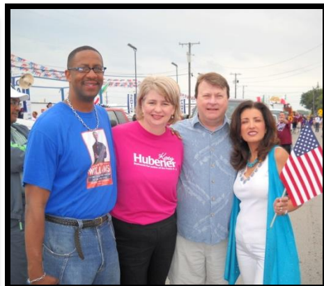
Grand Prairie Cinco de Mayo Parade