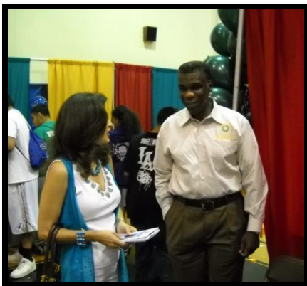
Irving Cinco de Mayo festivities