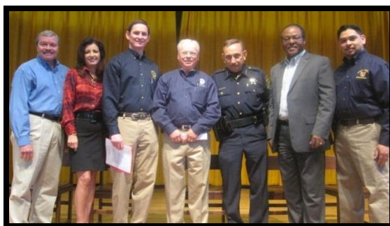
Pep Rally at Anson Jones Elementary