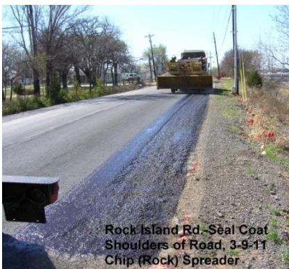
Rock Island Rd.-Seal Coat Shoulders of Road, 3-9-11 Chip (Rock) Spreader