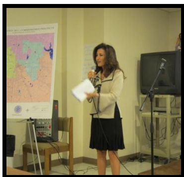
Presentation at Sta. Ma. De Guadalupe