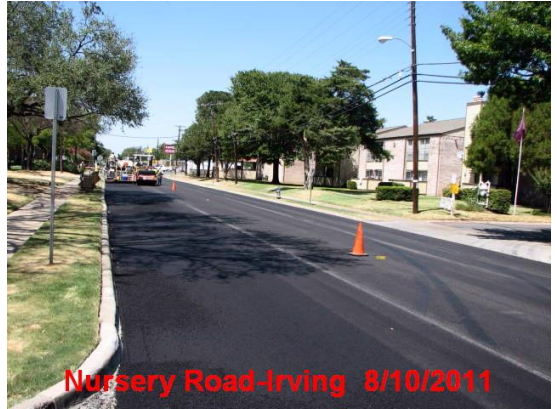
Nursery Road-Irving 8/10/2011