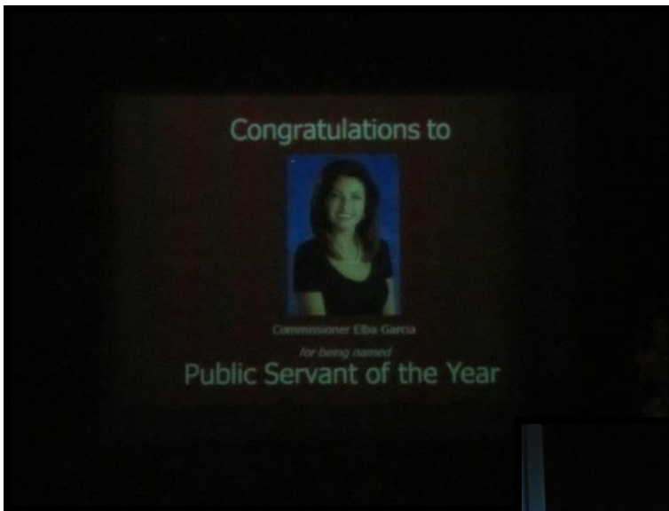
Centro de Teatro Bishop Arts