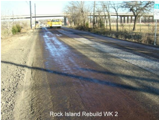
Rock Island Rebuild WK 2